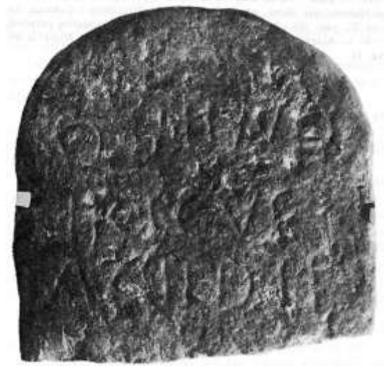
Fig. 24. Inscripción de Vendirico (Santa María del Naranco)

personaje como fuerza motriz de sus actividades mientras todavía habitaba esta vida 155 .