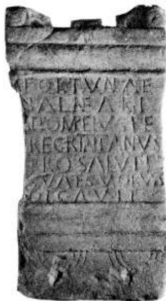
Fig.2. Altar consagrado a Fortuna de los Baños (Pumarín, Gijón)

con la diosa de la felicidad, de la prosperidad y del destino, y a la que los romanos rendían culto bajo distintas advocaciones; en nuestro caso el calificativo de Balnearis se relaciona con la presencia de unos baños o aguas salutíferas, tal vez de carácter termal (a este respecto tenemos conocimiento de que en abundantes zonas de baño de tiempos romanos existía una Fortuna como divinidad protectora) 17 .