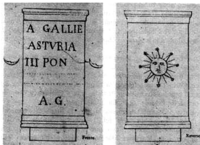
Fig.4. Reproducción de la inscripción desaparecida de San Jorge de Heres (Gozón)

El rostro que aparece dentro del círculo solar, cuyos rayos rematan en estrellas, es posible que se halle enmarcando a la representación de la difunta en la simbología propia del mundo del más allá; creemos, además, que esta idea vendría corroborada por la presencia de sendos crecientes lunares en cada una de las caras laterales de la piedra, combinando de esa forma el ámbito astral en el que se acogería el alma de la difunta y su trascendencia en el más allá.