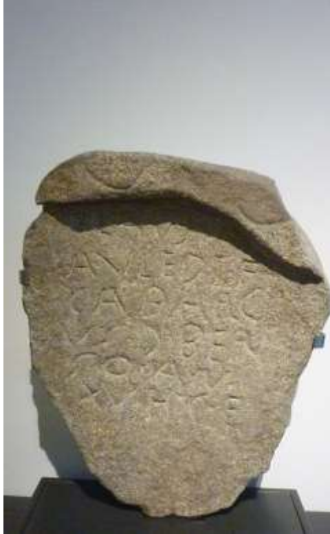
Fig.6. Epitafio de Flaus Cabarcus (Ablaneda, Salas)

aceptado por un abundante número de indígenas de la región como manifestación del proceso de romanización, también en el terreno de la nomenclatura de los antropónimos 42 .