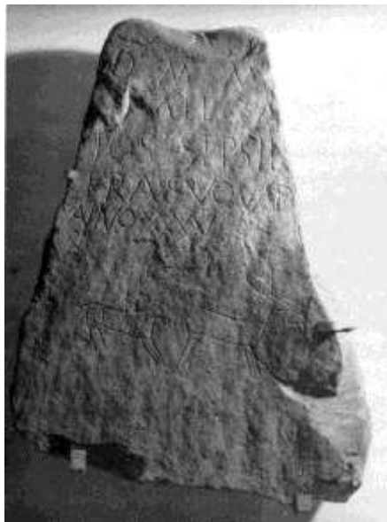
Fig.14. Epitafio de Lucio Septimio Silón

- 2) y que su nombre sería realmente Silón, al igual que el del personaje que estamos analizando, así como los que vamos a mencionar a continuación y tantos otros que se mencionan en la epigrafía hispanorromana, en la que se recogen numerosos nombres indígenas de esa misma nomenclatura.