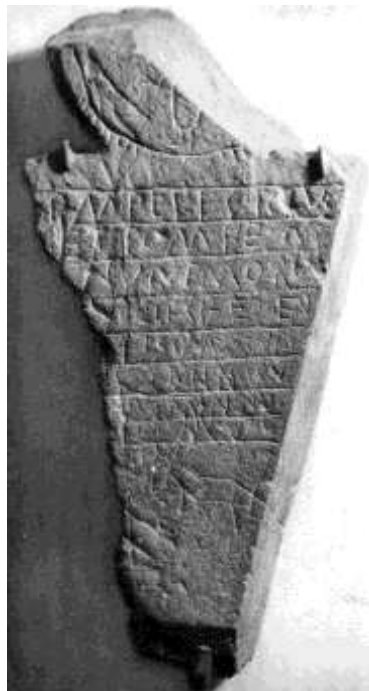
Fig.15. Lápida sepulcral de Superia

Este documento, aunque cuenta en su campo epigráfico con parte del formulario pagano, ha sido considerado cristiano por el contenido del mismo, aunque sus rasgos definitorios sean mucho menos claros que con respecto a los epitafios de Magnentia y Noreno 100 , hallados ambos en Soto de Cangas de Onís 101 .