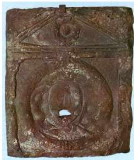
Fig.3. Ara anepígrafa de San Martín de Laspra (Castrillón)

hipotético disco astral de la parte baja; de esta manera la representación que se inscribe en este último círculo no sería la de una gorgona 24 (a pesar de haber sido utilizada modernamente como lugar para encajar en su boca una fuente) sino la de la persona (posiblemente una mujer) a la que servía de epitafio.