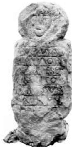
Fig.20. Estela antropomorfa de Selorio (Villaviciosa)

El perfil de la cara esquematizada, rodeada a su vez por un círculo, resulta comparable al anteriormente analizado así como a la estela de Forniellu (Ribadesella), en este caso con trazos mucho más tenues 138 ; ahora bien, al igual que hemos puesto de manifiesto en el caso anterior, es posible que tengamos que vincular dicha iconografía con una posible representación astral, sumida a su vez en el mundo del más allá.