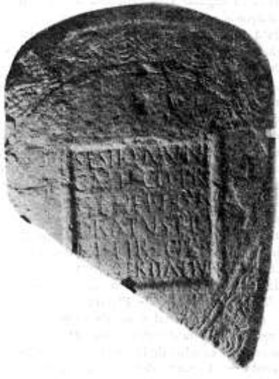
Fig.22. Estela de Valduno (Las Regueras)

¿Y qué sucede, por último, con un conjunto de monumentos epigráficos, igualmente de carácter funerario, aparecidos en territorio asturiano en estado fragmentado, por lo que desconocemos si en su cabecera contaban o no con iconografía y, en caso afirmativo, si ésta representaba algún elemento en relación con las figuraciones astrales (o de otro tipo) vinculadas al mundo de ultratumba?