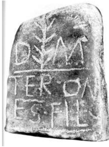
Fig. 19. Lápida funeraria de Posada de Llanes

Por su parte la fractura de la piedra en su parte inferior (y posiblemente también en su margen derecho) deja incompleta la lectura del campo epigráfico de esta lápida funeraria: debajo de los renglones primero y tercero hay grabadas sendas rayas horizontales (únicamente consta de 3 líneas por la fragmentación de su parte inferior).