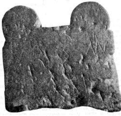
Fig.13. Estela ilegible procedente de Labra (Cangas de Onís)

Al tratarse sin duda de una inscripción funeraria es posible que tales remates de la cabecera correspondan a representaciones astrales, destinadas a asegurar la pervivencia del difunto (-a) en la otra vida.