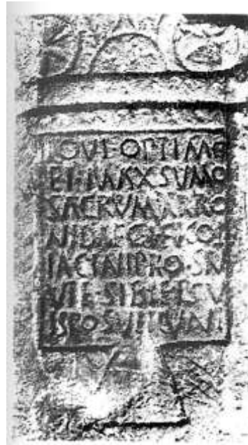
Fig.1. Ara dedicada a Júpiter (iglesia de Serrapio, Aller)

Sus partes superior e inferior enmarcan perfectamente el campo epigráfico, en un espacio algo más reducido, y pudiéndose vislumbrar el remate, en el que tal vez se daría acogida a los foculi , destinados al depósito de las ofrendas de los fieles de la divinidad a la que se dedica el monumento; el texto de dicha inscripción, recogido en 7 líneas, se halla expresado perfectamente (las letras son capitales y claras) en los siguientes términos: