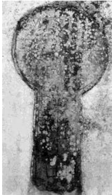
Fig.7. Estela discoidea de La Lloraza (Villaviciosa)

Además del disco solar que acoge la inscripción hemos de destacar la figuración representada en el vástago de la piedra, que sin duda hay que relacionar con algún sentido simbólico, tal vez similar al del trípode que aparece figurado en la cabecera de la dedicatoria funeraria a Nicer (La Corredoira, Vegadeo).