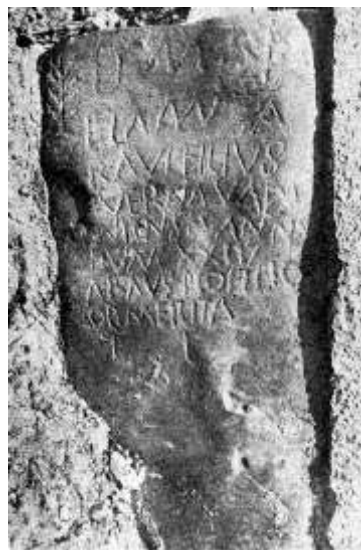
Fig.23. Estela funeraria de Elano (Soto de Cangas de Onís)

“(Consagrado) a los dioses manes. Elano Verna, hijo de Aravo, vadiniense, de 24 años (de edad). Aravo (lo dedica) a su piadoso hijo por (sus) méritos. ¡Que la tierra te sea leve!”