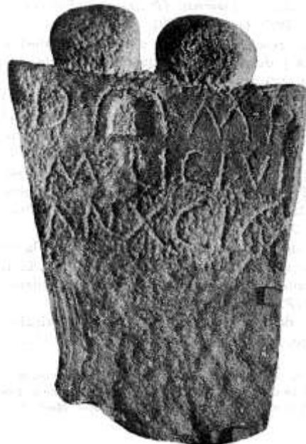
Fig.12. Monumento funerario de Marco Licinio (Forniellu, Ribadesella)

“Monumento consagrado a los dioses manes. Marco Licinio, (que) vivió 91 años”.