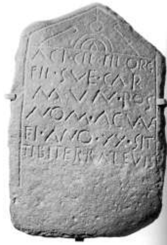
Fig.18. Epitafio de Acuana (Torreveiga, Llanes)

En cuanto a su morfología se corresponde con el tipo de estelas oicomorfas (configuradas en forma de casa), que tan comunes resultan en otros ámbitos geográficos de la Península, y que además constituyen un conjunto afín por su cultura y por su población, como por ejemplo en la región de Salas de los Infantes (provincia de Burgos) 121 .