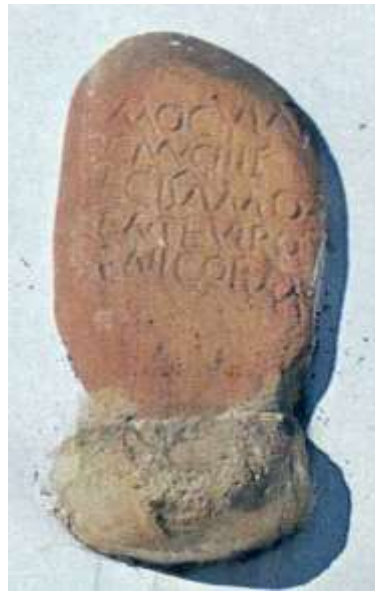
Figura 25. Monumento funerario de Oculatio (Villamayor, Piloña)

correspondientes; la presencia del sol en tales figuraciones parece implicar su importancia como referente en el más allá, es decir en esa regeneración diaria que el nacimiento cotidiano del astro rey realiza para que la vida vuelva a brotar en el mundo de ultratumba.