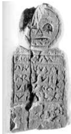
Fig.19. Estela antropomorfa de Molleda (Avilés)

La representación ofrece, perfectamente visibles, los ojos (uno mejor conservado que otro) a modo de medios círculos, así como una nariz triangular y una boca punteada 135 .