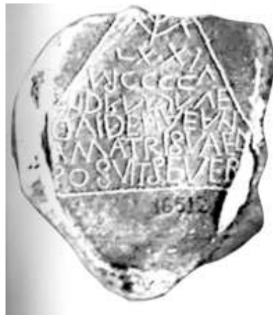
Fig.17. Estela de Dovidena (Museo Arqueológico Provincial de Oviedo)

Con respecto a su procedencia cristiana o no, Vives consideró, hace ya algún tiempo, que se trataba de un documento cristiano, debido al hecho de que no contiene ninguna referencia (fórmula) y/o símbolo pagano 115 ; no obstante, Hübner la compara 116 con otra lápida encontrada en territorio británico, cuya lectura se inicia igualmente por el renglón último, sin atreverse a considerarla como cristiana.