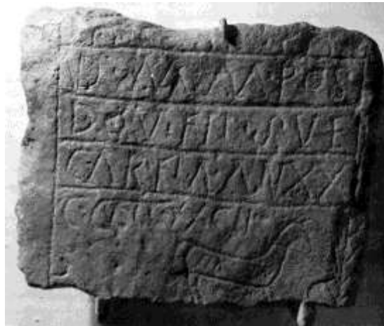
Fig.16. Monumento funerario de Flavia

"Monumento consagrado a los dioses manes. Dovidero (lo dedicó) a su querida hija Flavia, de 20 años de edad en la era consular 482". (en el caballo) "¡Flavia, que venzas!".