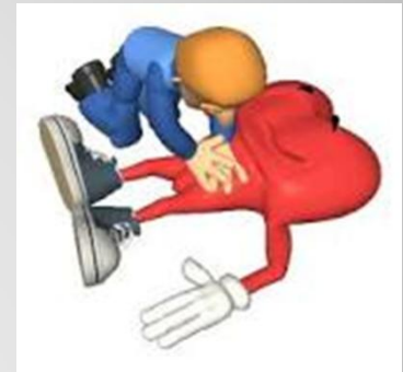
Imagen de homo ludens (blog de apoyo a clases de E.F)