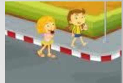
Ilustración De Un Niño Cruzando La Calle Ilustraciones