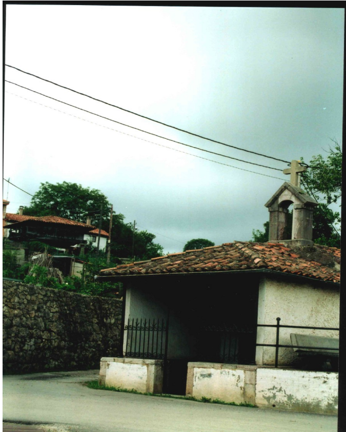
7.- Pórtico de la iglesia. Donde recibía escuela Manolo.