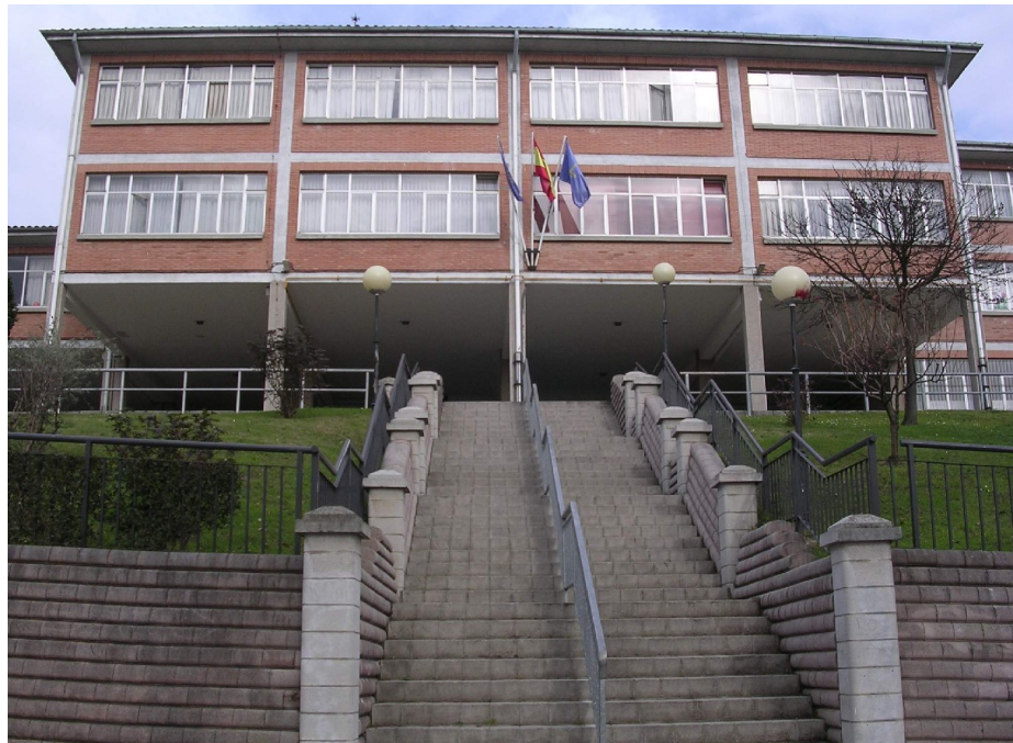
8.- Colegio de Vanina.