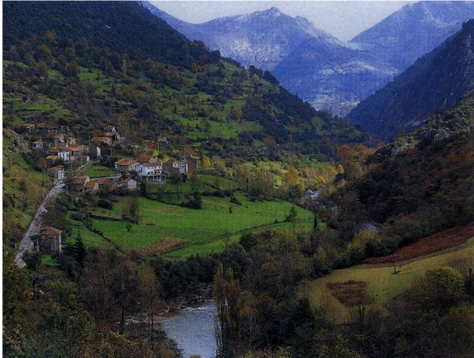
3.- El pueblo de Manolo