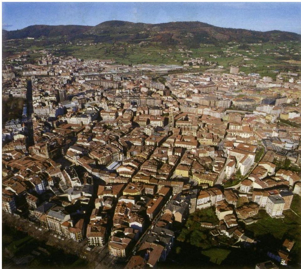
4.- La ciudad de Vanina