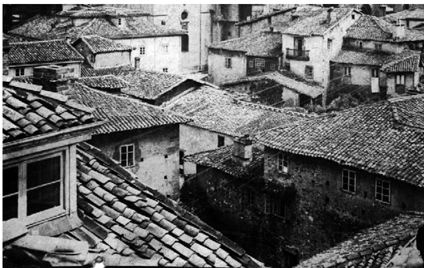
Figura 3. Casas de la Catedral de Oviedo (P-431). Galería de imágenes.

cada a la figura del mercader medieval, «debe verse en estas torres una señal contundente de la asimilación de la rica burguesía con la nobleza» 48 . Y, junto a la altura, prueba también del prestigio de determinadas viviendas urbanas será la presencia en las viviendas de chimeneas o de capillas interiores, como la que había en la casa del Chantre, o bien de accesos directos, como el que comunicaba el interior de la Casa de Santa Gadea con la capilla de Santa Ana en Oviedo 49 .