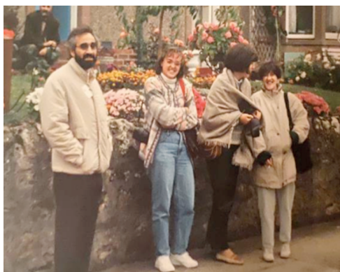
Momentos de distensión después de una dura jornada y muchas risas... EUROANALYSIS VIII (European Conference on Analytical Chemistry) Edinburgh, U.K. (1993).