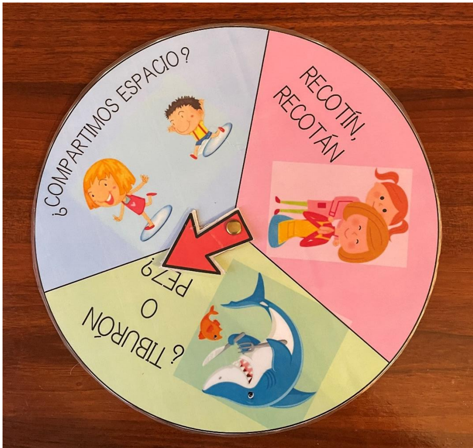
Figura 1. Ruleta para la realización de juegos