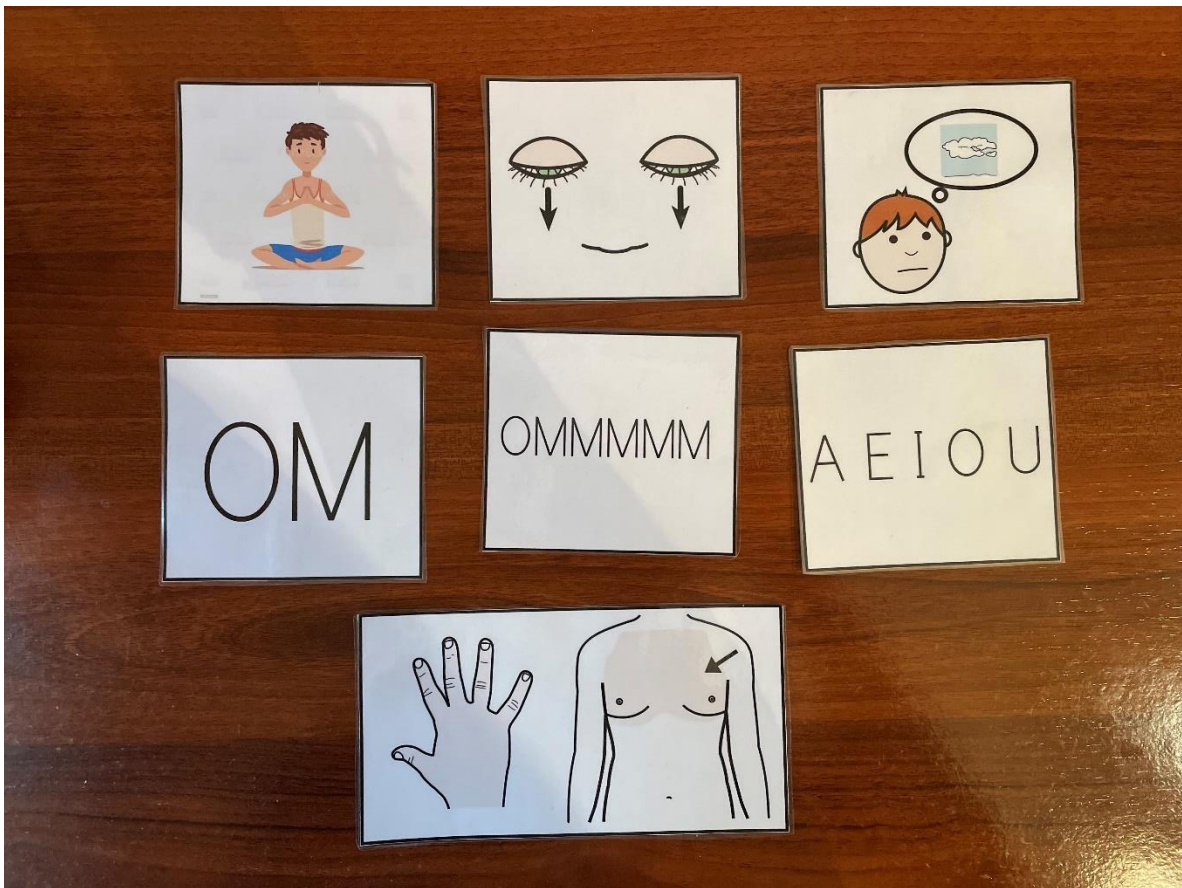
Figura 4. Pictogramas para la guía del niño TEA en la actividad 10