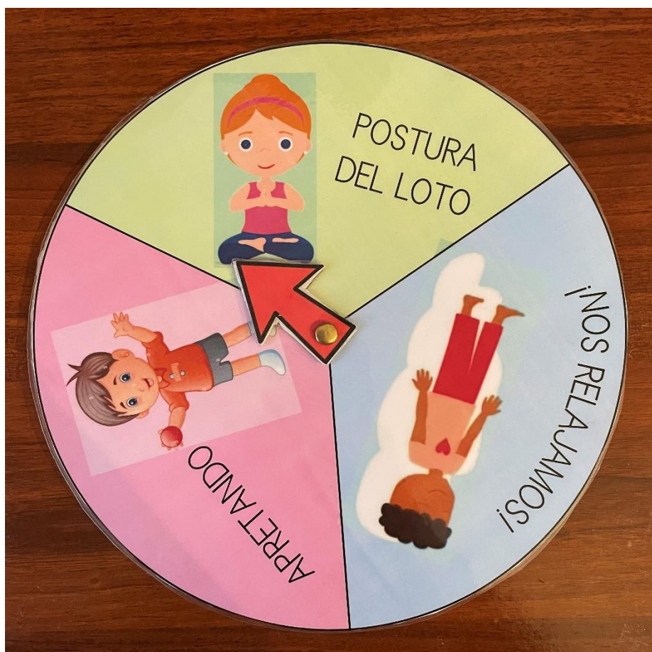
Figura 2. Ruleta para las actividades de relajación