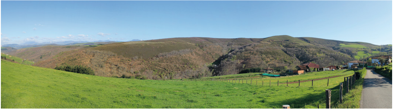
FIGURA 2: Vista panorámica de la lladera norte de la sierra dende'l llugar d'Abaniella.

te-suroeste. Nel procesu d'escavación comprobamos que l'afección de la obra de la carretera fuera munchu mayor de lo previsto, hasta'l puntu de suponer la pérdiga de casi la totalidá de la estructura. El sondeo amostró cinco niveles estratigráficos: