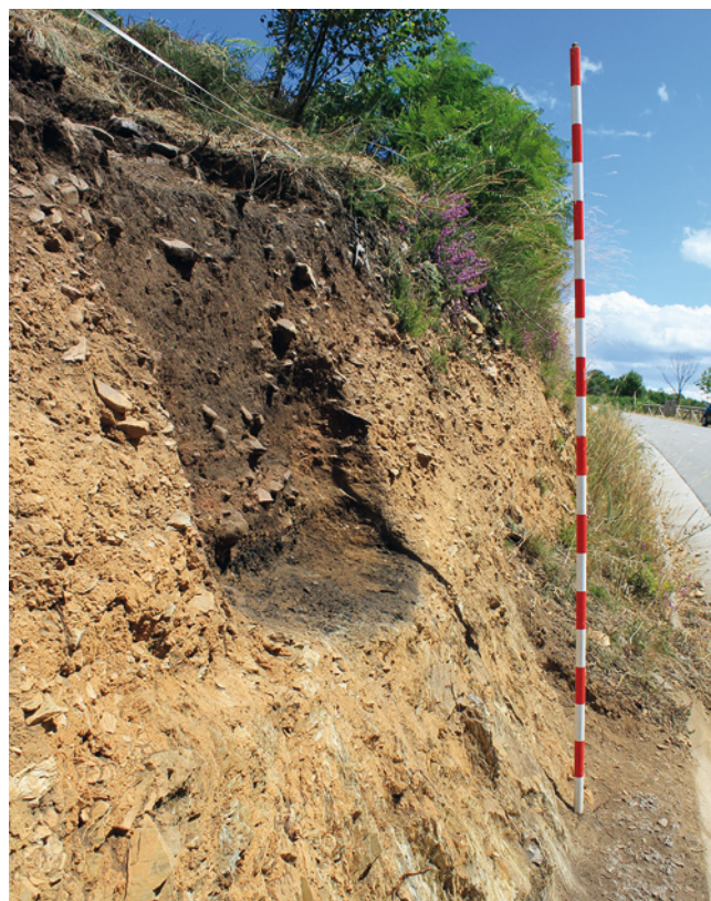
FIGURA 5: Vista del sucu de la carretera onde s'observa la inclinación y la pérdiga de la parte superior de la poza.

• Lo demás del rellenu divídese en dos subniveles que formen parte d'un mesmu momento d'uso pero presenten una materialidá distinta. Cubierta pola UE-IV documentamos un estrato (UE-VIIa), con un grosor máximu de 20 cm, compuestu de siete camaes fines qu'alternaben tonos claros y escuros. Los claros teníen una composición predominantemente arcillosa, mientras que nos escuros abundaba'l material orgánico. Debaxo d'estos camaes y llenando tol fondo de la poza hai un nivel últimu (UE-VIIb) compuestu por carbones de tamaños diversos onde reconocemos raíces d'ericácees o carroubas –nome que-yos dan n'Ayande–, usaes hasta l'actualidá pa la combustión pol so potencial calorífico (Figura 6).