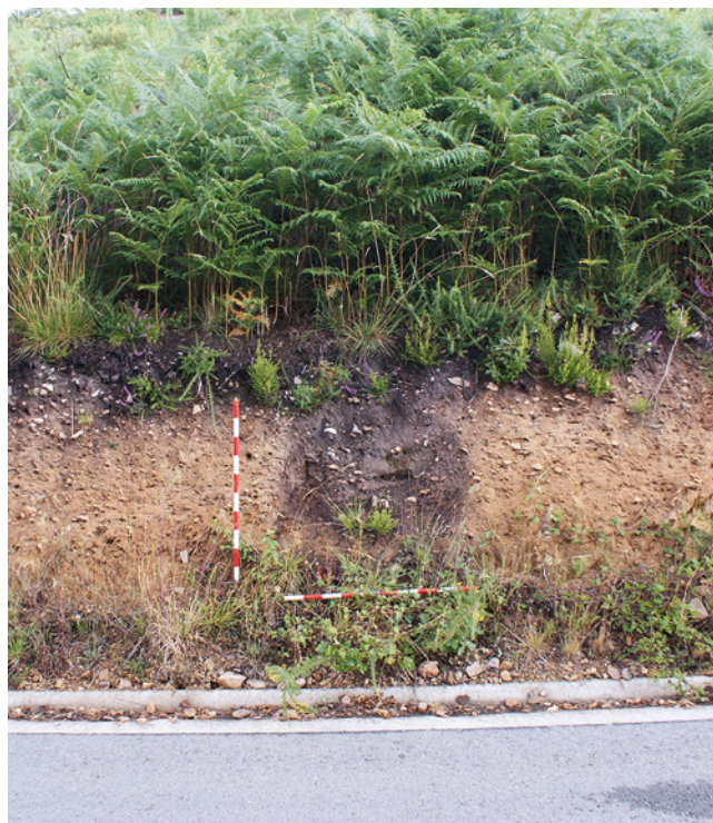
FIGURA 1: Aspecto de la estructura al principiu de la intervención.