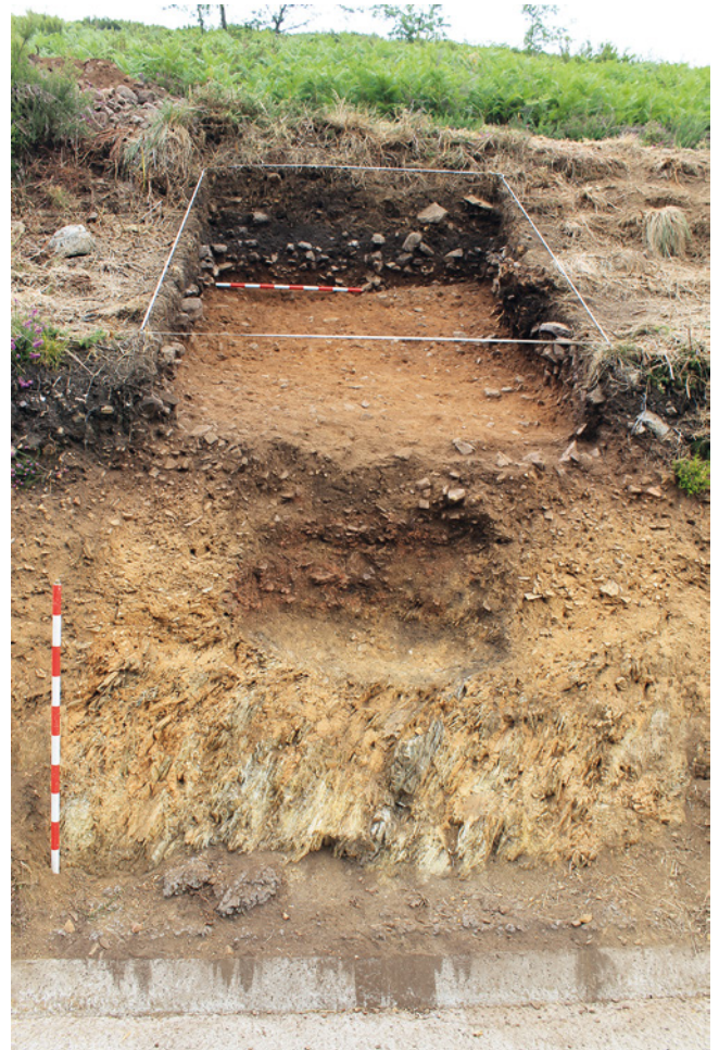
FIGURA 3: Aspectu final del sondeo col nivel basal de tapión a la vista.

Primero d'escavar la UE-IV y pol peligrosu que víemos d'afectar a la estructura al intervenir nel nivel inmediatamente superior, pasóse al vaciamientu del conteníu de la poza. Esta unidá estratigráfica negativa, denominada UE-VI, ye una fuexa escavada nes arcielles de la UE-V hasta llegar a la profundidá máxima que marca'l contactu d'estes cola peña. Les dimensiones de los restos conservaos son de 80 cm d'altura máxima por 108 cm d'anchura máxima. Los restos de la base suxeren una planta orixinal de tendencia