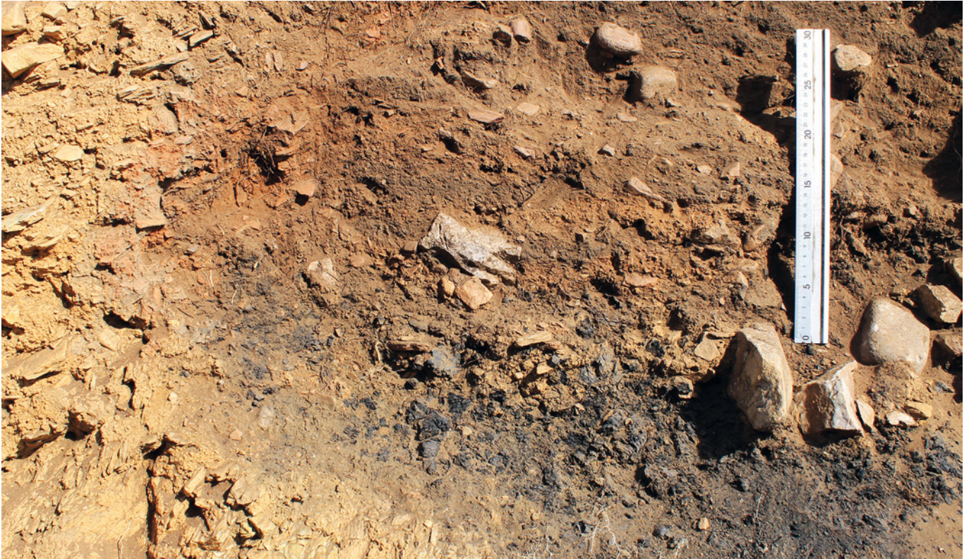
FIGURA 6: UE-VII durante la excavación de les camaes de la UE-VIIa.