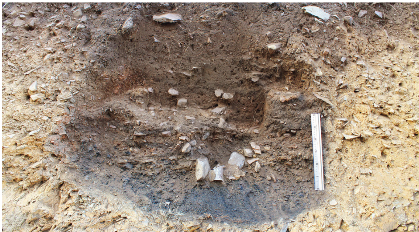
FIGURA 4: Contenido de la poza durante el proceso de excavación de la UE-VII.

temperatura alta de materiales nel so interior. En cuantes al rellenu, observamos varios niveles (Figura 4):