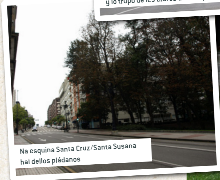
Na esquina Santa Cruz/Santa Susana hai dellos pládanos