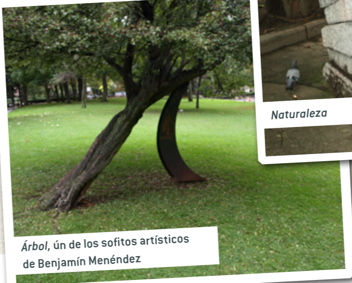
Árbol, ún de los sofitos artísticos de Benjamín Menéndez