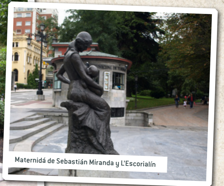
Maternidá de Sebastián Miranda y L'Escorialín

Carbayu (el roble Quercus robur ), hai per pocos d'ellos nel Campu, entá nuevos y pequeños (menos ún dalgo más crecíu); la mayoría tán nel Paséu de la Herradura , que ta presidíu pol quioscu la música, una obra de Miguel de la Guardia (1889) a la que se xube dende otu paséu: el del Bombé.