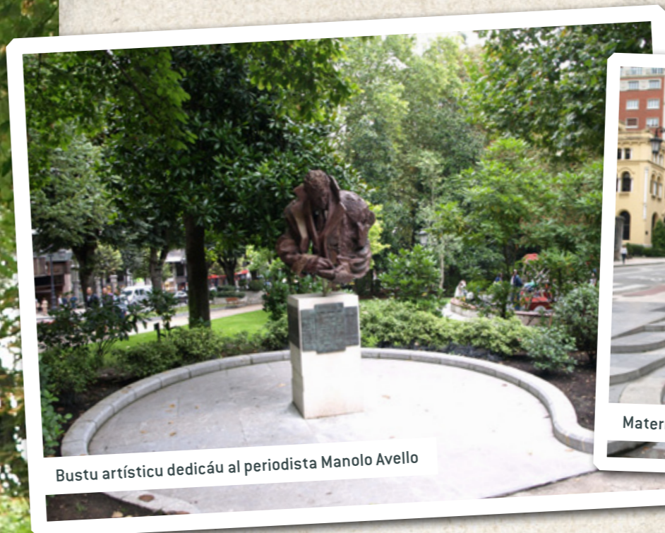
Bustu artísticu dedicáu al periodista Manolo Avello