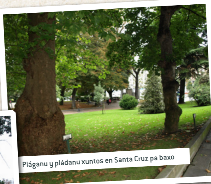
Pláganu y pládanu xuntos en Santa Cruz pa baxo