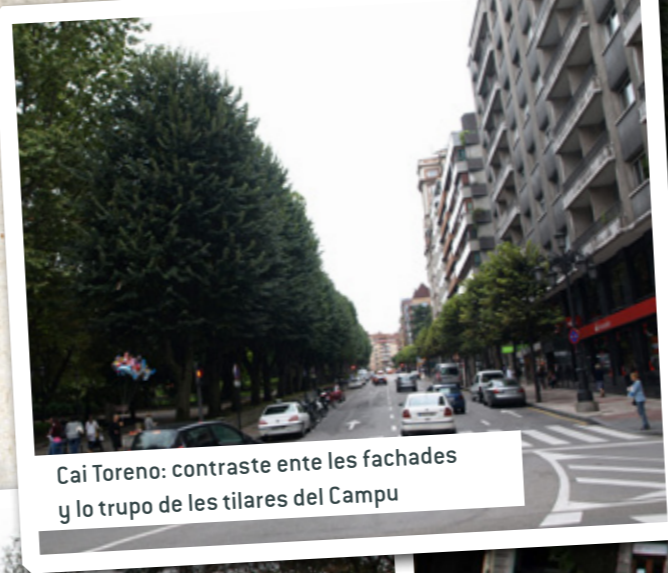
Cai Torono: contraste ente les fachades y lo trupo de les tilares del Campu

Los grandes vecinos del Campu San Francisco son namái dos o tres especies: los plárganos, Platanus hybrida , son un híbridu mui resistente, polo que ye maltratáu y podáu en paseos y xardinos grandes y pequeños d'Asturies. Nel Campu atopamos xigantescos y espectaculares exemplares. Castañales d'Indies, Aesculus hippocastanum , hailes tamién pergrandes, mentanto que los pládanos, Acer pseudoplatanus , son más cuntaos.