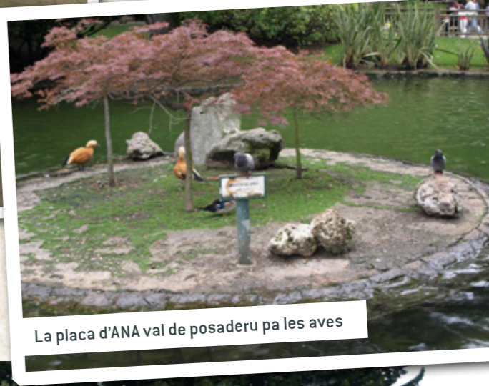
La placa d'ANA val de posaderu pa les aves