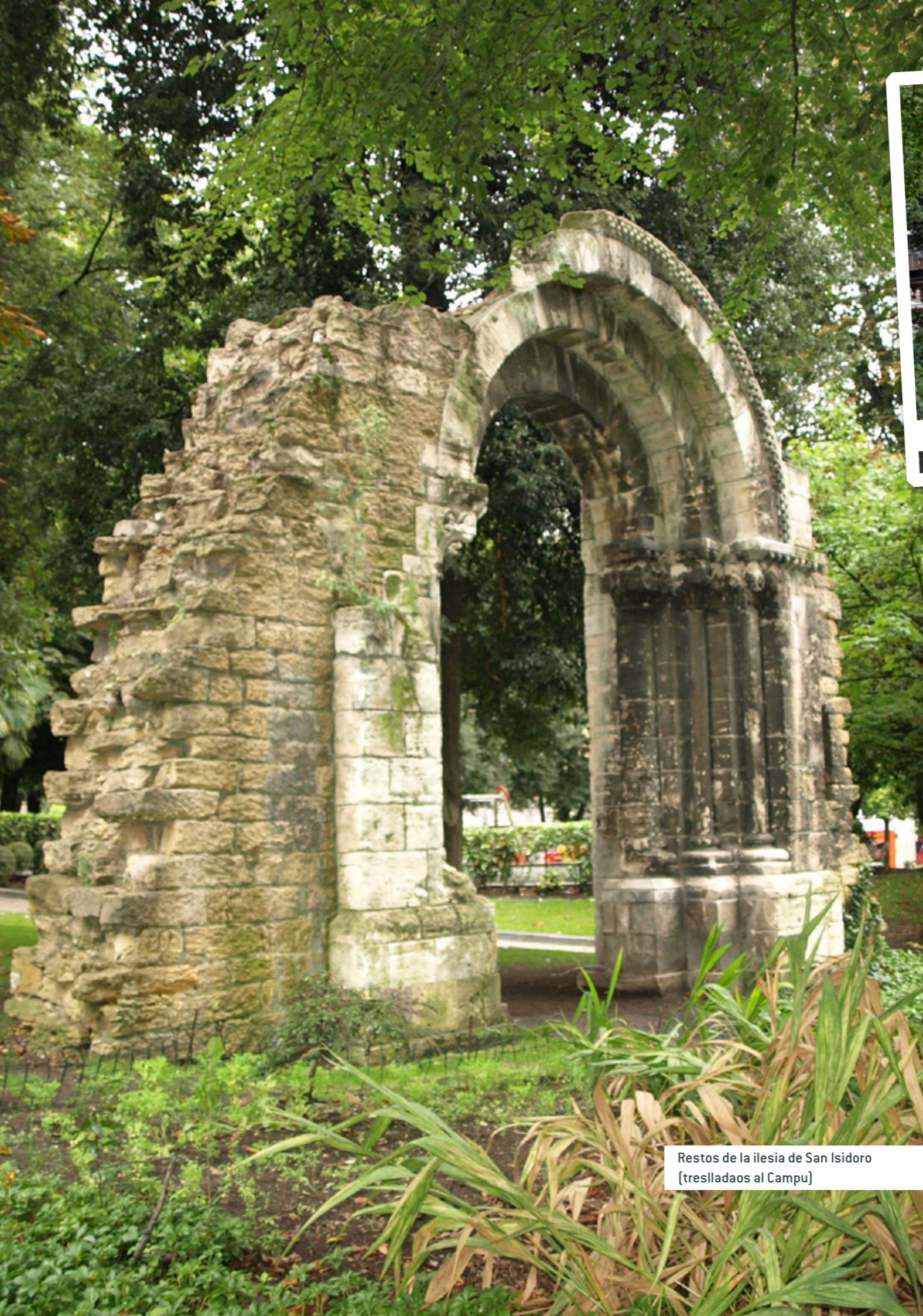
Restos de la ilesia de San Isidoro (treslladaos al Campu)