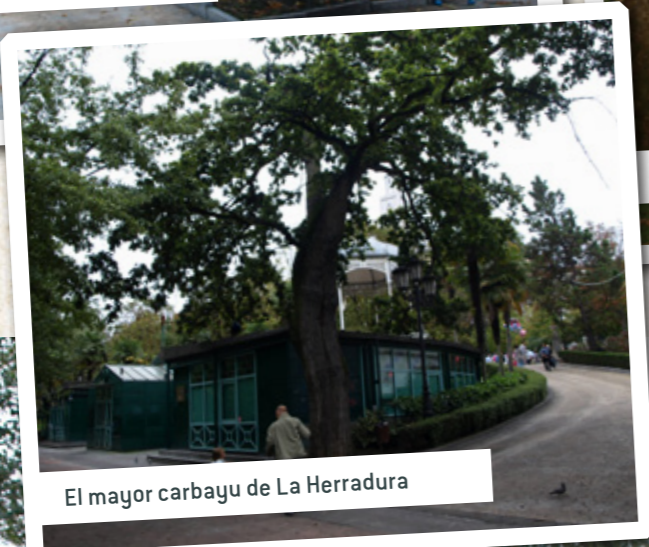
El mayor carbayu de La Herradura