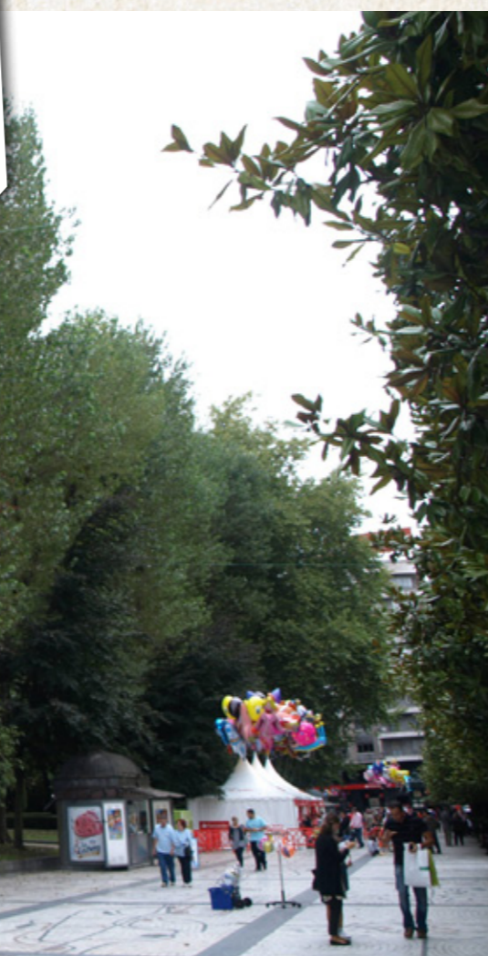
Paséu de los Álamos y mosaicu d'Antonio Suárez