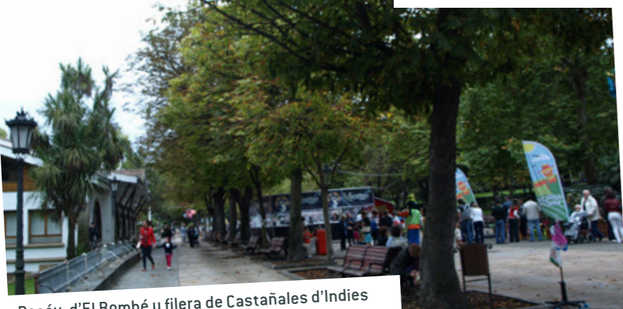
Paséu d'El Bombé y filera de Castañales d'Indies

El Xardín Botánicu de la Universidá d'Uviéu ocupó la zona al rodiu la fonte l'Anxelín ente los años 1846 y 1871, cuando la Casa Conceyu d'Uviéu lo axuntó al restu'l Campu