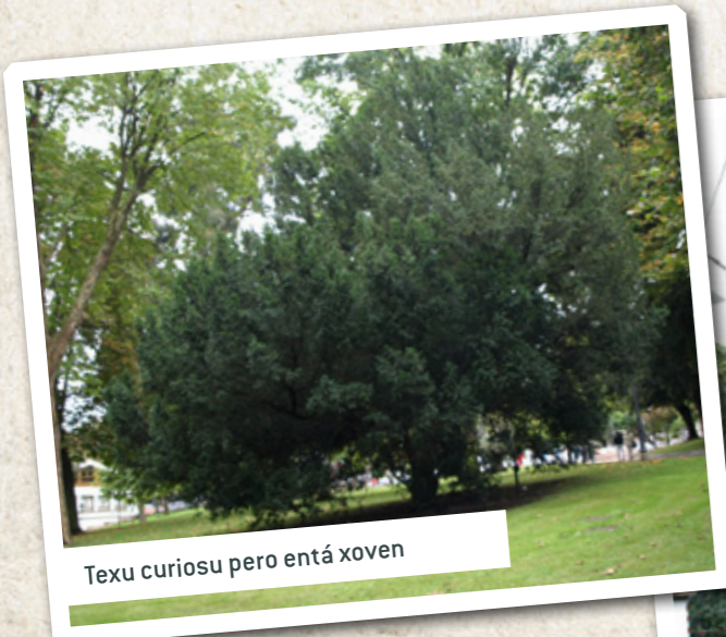
Texu curiosu pero entá xoven

ANA catalogó les plantes del parque uviéin ya iguó los primeros lletreros d'elles nel añu 1981