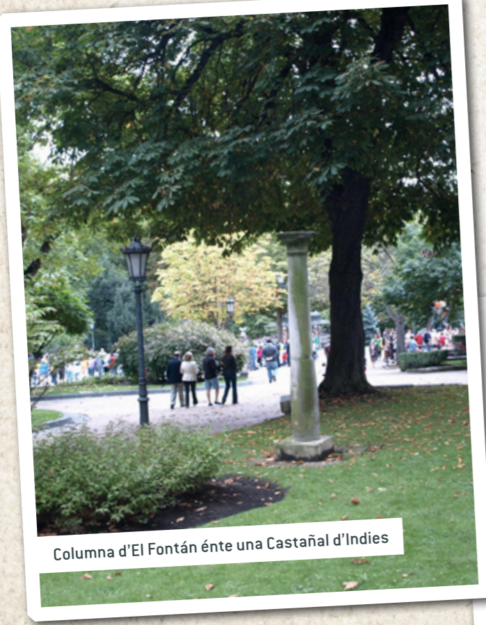
Columna d'El Fontán énte una Castañal d'Indies