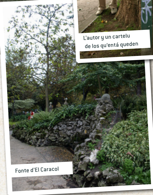
Fonte d'El Caracol