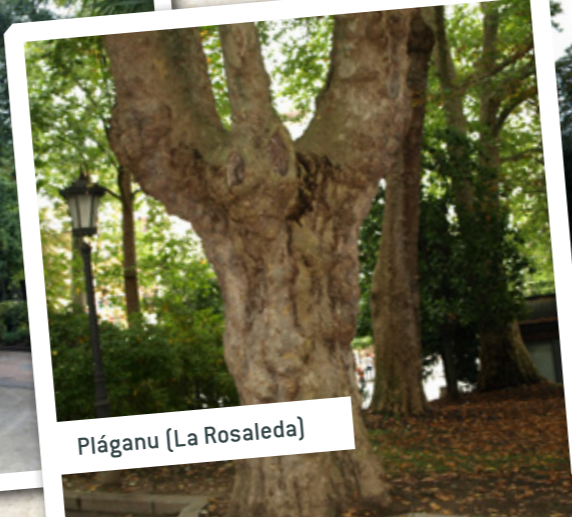
Pláganu (La Rosaleda)