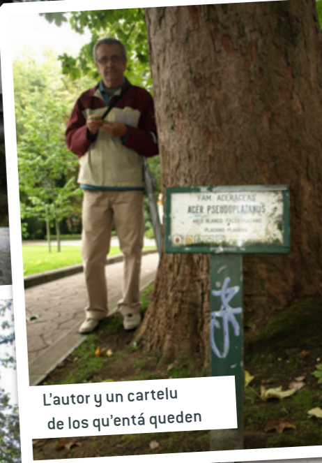
L'autor y un cartelu de los qu'entá queden