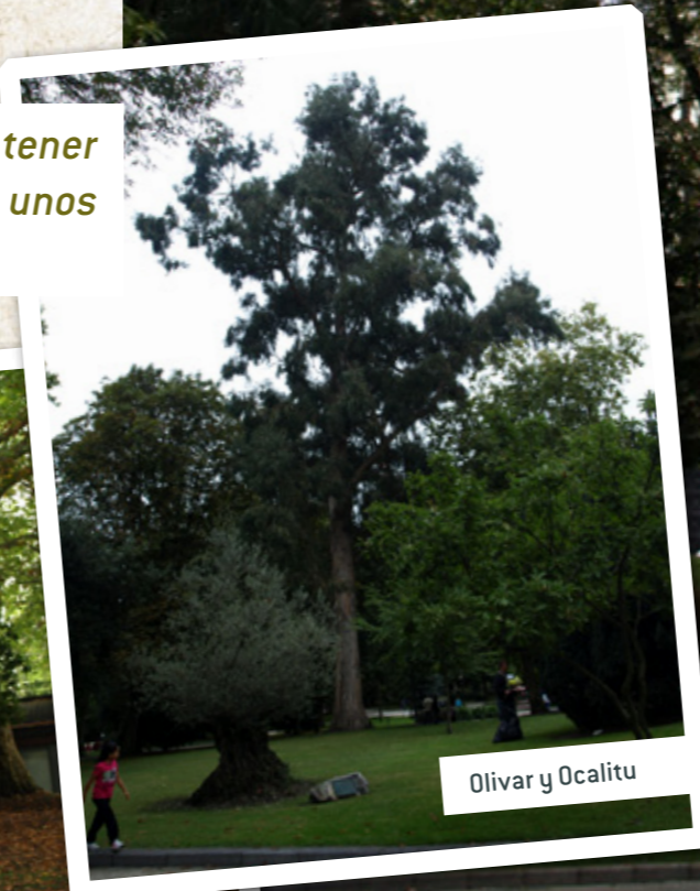
Olivar y Ocalitu

En 100 años, el Campu pasó de tener 2.436 exemplares vexetales a unos 1.000