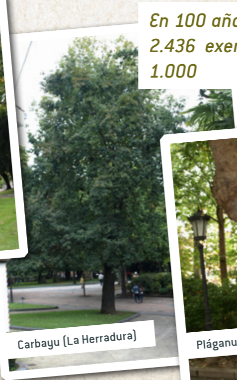
Carbayu (La Herradura)