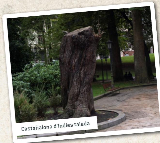
Castañalona d'Indies talada

Grandes, altísimos y guapísimos exemplares, auténticos arbolones dalgunos, d'esos tres especies son lo más carauterístico del nuesu primer parque. Amás d'elles tres, que monopolicen lo que queda de la vieya «viesca», les tilares (otres dos o tres especies) son abondoses al par de les cais Santa Susana y Conde de Toreno, onde 40 exemplares de Tilia platyphyllos marquen la llende'l Campu, y otra filera de la Tilar Americana ( T. americana ) allúgase na otra acera, la del Bancu d'España. Esti bancu ta onde yera'l xalé