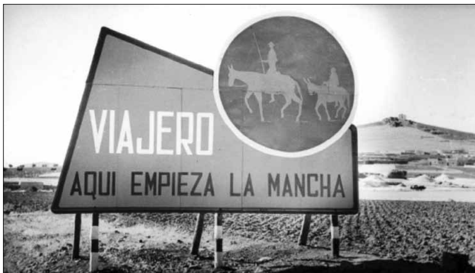
Figura 3 PUBLICIDAD INSTALADA EN LA CARRETERA (Década de los 50 del siglo XX)