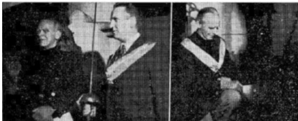
Figura 6 CEREMONIA DE ARMAR CABALLEROS A LOS VISITANTES