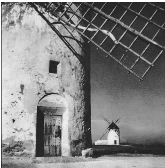
Figura 2 MOLINOS EN CAMPO DE CRIPTANA