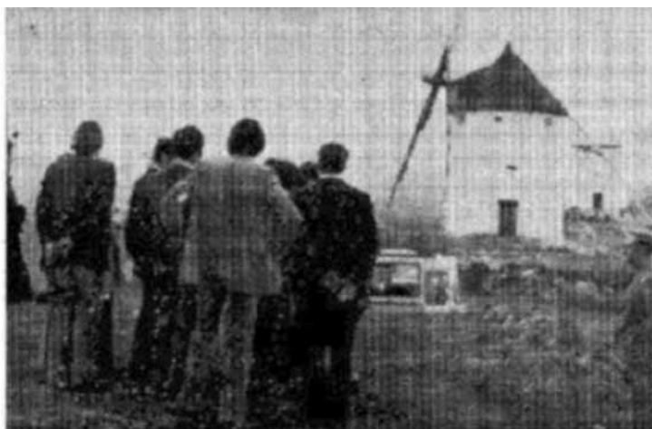
Figura 5 LA EXPEDICIÓN CONTEMPLANDO LOS MOLINOS DE CONSUEGRA (TOLEDO)