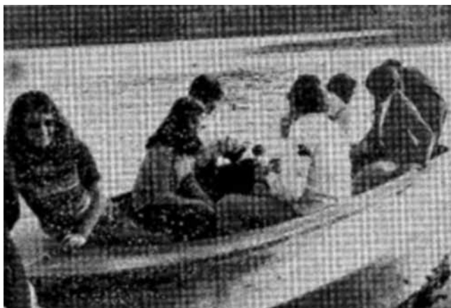
Figura 8 PASEO POR LA LAGUNA COLGADA (Lagunas de Ruidera)