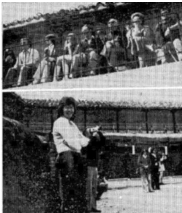
Figura 7 PLAZA DE TOROS DE LAS VIRTUDES