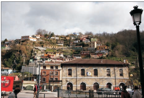
FIG. 4. Ladera cargada de viviendas autoconstruidas de los años cincuenta-sesenta, en las proximidades de la estación de Feve, en primer término, de Sama.

Así que la transigencia o complicidad del Ayuntamiento explica la ocupación de una plaza tan simbólica como la del mercado de ganados en el centro de Sama (primer ensanche de fines del siglo XIX), mientras que los conflictos de la Corporación municipal con la inmobiliaria felguerina en una primera fase (que algunos coetáneos interpretaron como otro episodio de la vieja rivalidad po-