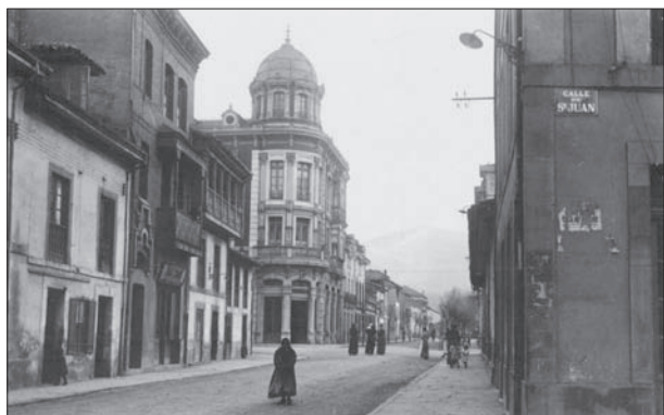
FIG. 6. La calle Constitución de Sama, uno de los tramos rectos de la carretera Oviedo-Campo de Caso a principios del siglo xx.