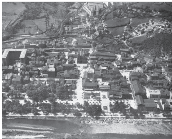
Fig. 9. Vista parcial de Sama en 1956 con el edificio Felgueroso, a la izquierda, todavía inacabado. En primer término, el río Nalón y el parque Dorado.

Por otra parte, el nombre de la inmobiliaria fue tomado del apellido Felgueroso, correspondiente a una de las familias de la burguesía industrial asturiana con mayor capacidad de influencia gracias a sus negocios mineros en la cuenca del Nalón y a su notable participación en el accionariado de la Duro-Felguera. Los Felgueroso