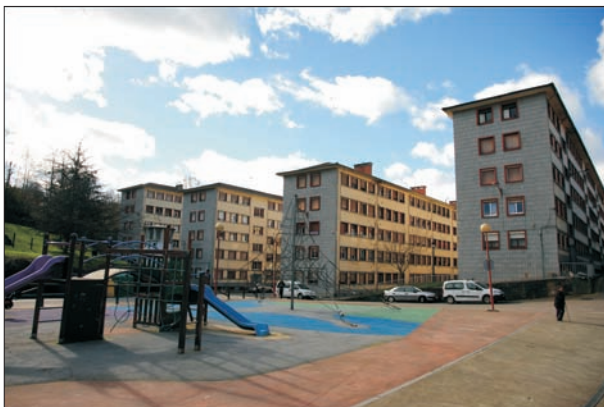
FIG. 3. Bloques de la barriada de Inelasa, popularmente conocida como Pénjamo, en La Reguera, La Felguera. Es una obra de Cosusa, de los años sesenta, según proyecto de Juan José Suárez Aller.

la pérdida de recursos para su transformación debida a la crisis minero-industrial desde los años setenta del siglo pasado. Y en su composición cabe diferenciar, de manera sintética, los tres elementos siguientes (Fig. 2):