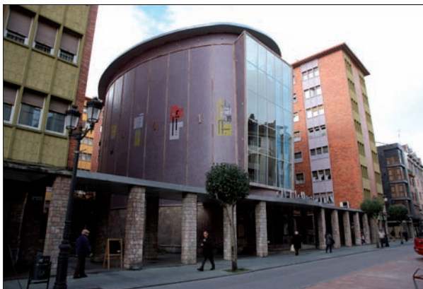
FIG. 10. Vista del edificio Felgueroso, con la singularidad del cinematógrafo de planta oval en el centro.

Se trata, pues, de una morfología muy peculiar, resultante de un esmerado tratamiento arquitectónico que se