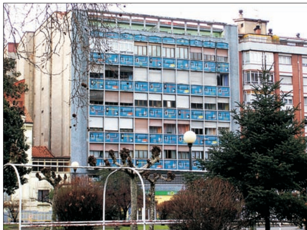
FIG. 8. Casa Suárez, uno de los primeros edificios de la remodelación en altura del primer ensanche de Sama. Obsérvese la fachada de mosaico con figuras abstractas. Fue residencia de la familia Suárez y del alcalde Miranda. Obra de Juan José Suárez Aller.

ticas derivadas de la posibilidad del recurso a la expropiación forzosa.