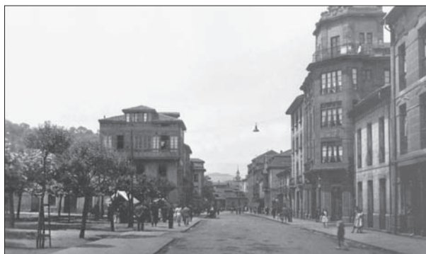
FIG. 7. La calle Dorado a principios del siglo xx. A la izquierda, la plaza arbolada del mercado de ganados.

Para dar cabida al mercado semanal de ganados, una de las actividades comerciales más significativas de la