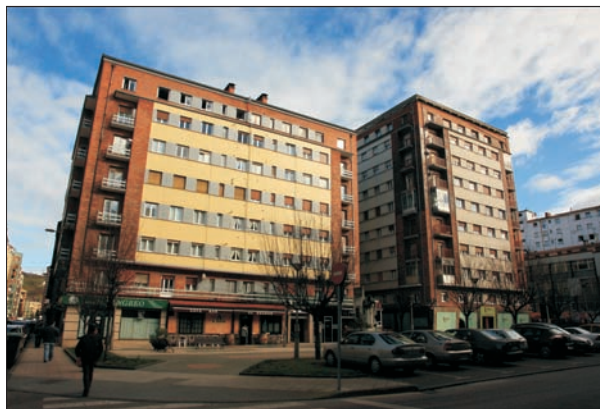
FIG. 12. Dos de los edificios de la inmobiliaria Setsa, obra de Marsá Prat, siguiendo los cánones del movimiento moderno que había utilizado previamente en Madrid. En primer término, la plaza de David Vázquez.

Fue la segunda Corporación democrática la que tomó la decisión definitiva de realizar la urbanización. A sabiendas de que los intereses particulares, instrumenta-