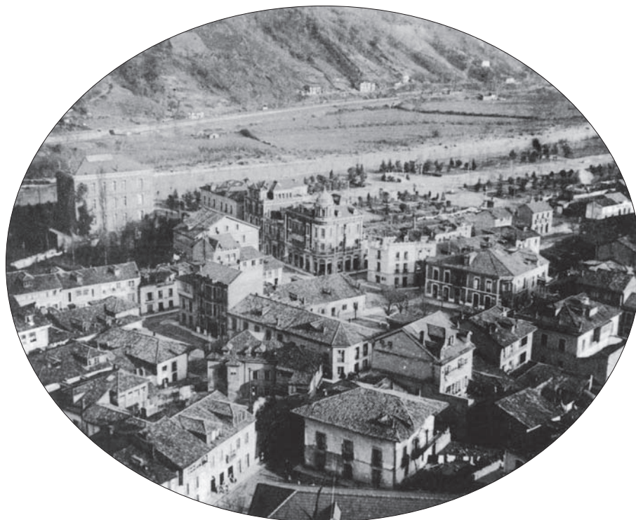
FIG. 5. Vista parcial de Sama en 1910, con el arbolado joven del parque Dorado y la vega sin urbanizar aún, a la derecha del río Nalón.

las condiciones de los transportes mantenían demasiado lejos a Langreo de la capital regional y de Gijón. Esa minoría dominante controlaba el Ayuntamiento y, a través de él, procuró organizar los espacios urbanos conforme a unos modelos geométricos, los de los ensanches decimonónicos, propiciadores de una ordenación del territorio después desdeñada, cuando aquélla abandona el espacio minero para residir en Gijón y Oviedo, o incluso fuera de la región.