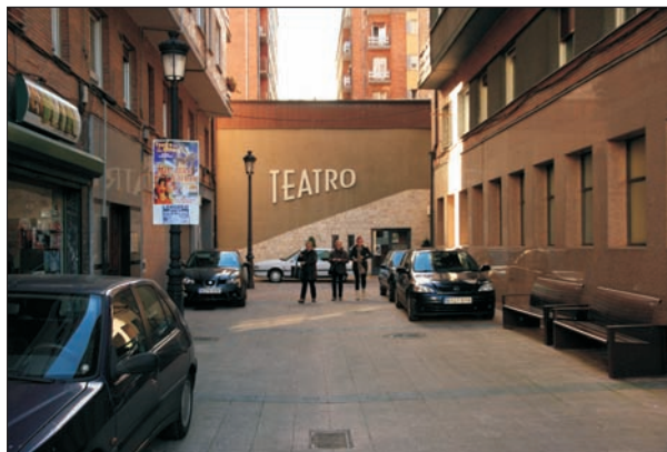
Fig. 11. El cine-teatro ocupa buena parte del espacio interior de la manzana del conjunto Setsa.

Por lo demás, abundan las coincidencias. En primer lugar, las temporales: la iniciativa se plantea a comienzos de 1953; y en segundo lugar, las jurídicas y financieras: la Junta Nacional del Paro concede a la operación la calificación de «bonificable», por lo que la constructora tiene en sus manos la posibilidad de la expropiación forzosa, mientras la financiación la garantiza el Instituto de Crédito para la Reconstrucción Nacional.