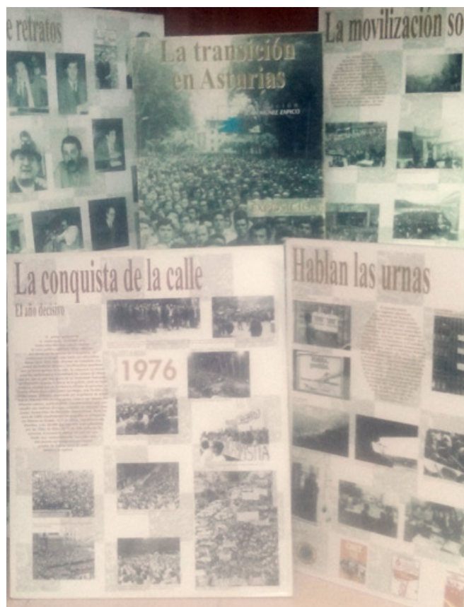
Fotografía de los antiguos paneles de la exposición La transición en Asturias .

35.000 visitantes y que recorrió los principales concejos y contó con una edición de catálogo, se buscará tanto el recuerdo de aquellos y aquellas que lo vivieron como llegar a las generaciones más jóvenes. Se llevará a cabo no solo desde un punto de vista meramente académico sino divulgativo, para hacerlo accesible a todo el conjunto de la población. Desde la autocrítica de lo sucedido, valorando conquistas y derrotas, pero desde el análisis histórico de la relevancia de aquel periodo y del papel determinante de la lucha de clases 2 .