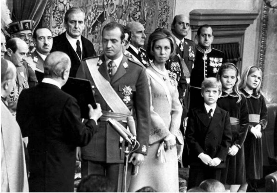
Juramento y proclamación de Juan Carlos I ante las Cortes. ABC (Madrid): Número del 23 de noviembre de 1975. Pág. 5 amplio reportaje sobre Don Juan Carlos. En portada “El Rey habla a su pueblo” http://hemeroteca.abc.es/