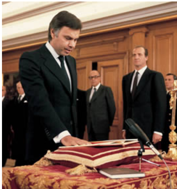
Felipe González jura la Constitución ante el Rey de España. http://www.psoe.es/pinto/docs/169959/page/primer-gobierno-socialista-1982-1996-.html (26.12.2015) (12.30)