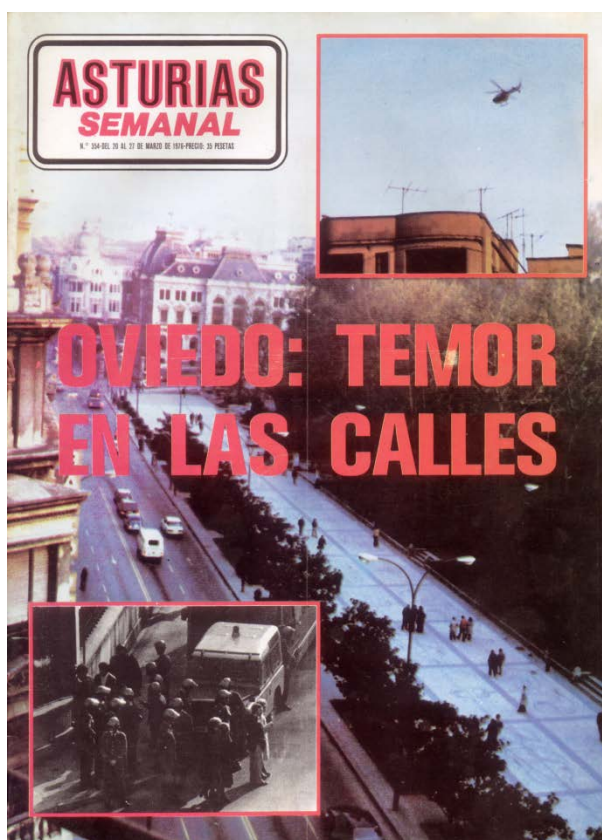
Portada asturias semanal.

En la calle Uría no lograba cristalizar ninguna formación de ningún grupo importante de manifestantes, hacia las seis de la tarde el paseo de los Álamos prácticamente desierto constataba la efectividad de un excesivo despliegue para una pacífica manifestación de signo laboral.