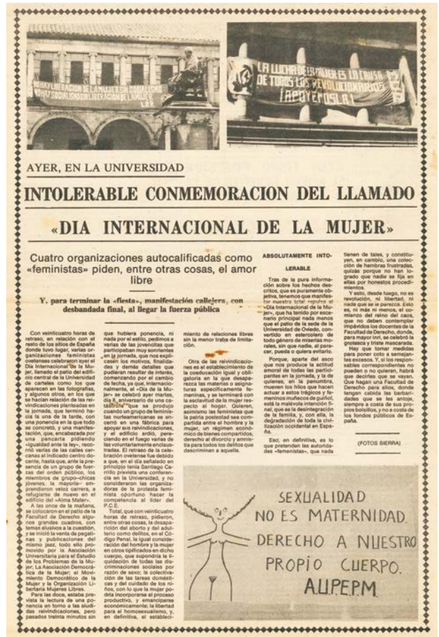
Recorte de diario

Los medios de comunicación se hacen eco de la jornada definiéndola como intolerable conmemoración del acto, o manifestación callejera, como puede verse en la página de un diario cedida por AFA. No se puede generalizar a todos los medios de comunicación ni mucho menos este caso. Destacar para finalizar la importancia de este acto celebrado por primera vez en nuestra región.