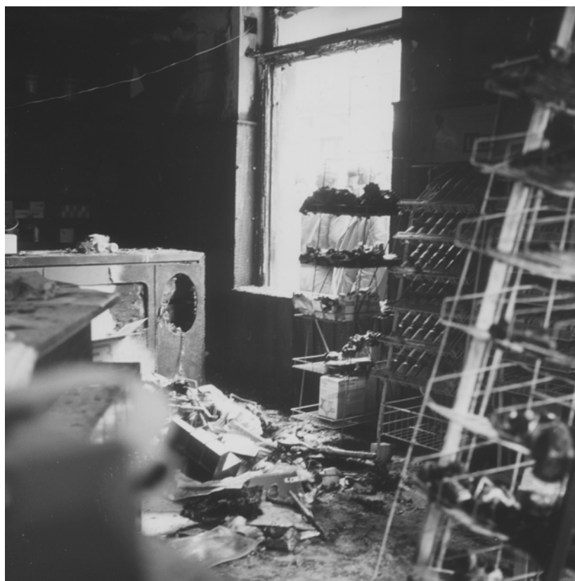
Imagen 2: Interior farmacia Palacios. Autor: J. M. Nebot. Localización FJMZ