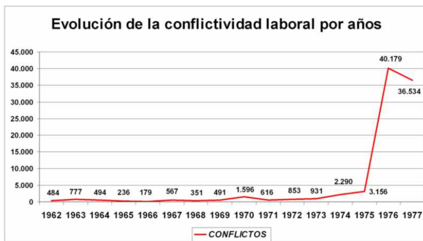
Grafica 1.- Evolución de la conflictividad social.

periódicos. Pese a que en 1966 se aprobó la Ley de Prensa e Imprenta 16 , se cerraron numerosos seminarios y diarios por todo el país. En el caso de las manifestaciones, protestas, asambleas y actos ilegales, muchas veces tenemos el testimonio de sus participantes pero no tenemos constancia fotográfica de las mismas por dos motivos, en primero lugar porque dado lo clandestino del acto los propios participantes no quieren dejar constancia del mismo o porque las fuerzas del orden lo censuran.