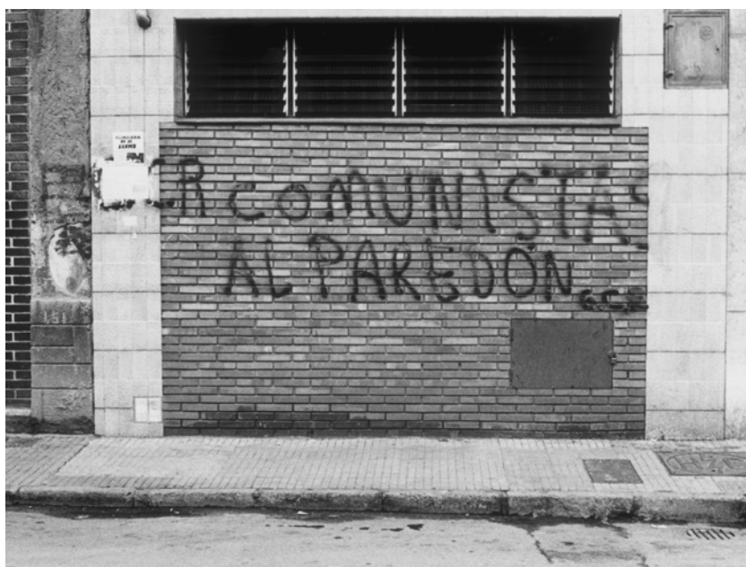
Fotografía en la que puede leerse “Comunistas al paredón”

En la imagen podemos ver el exterior de la farmacia, en otra imagen adjuntada en el anexo podemos ver el interior, mientras un grupo de personas se congregan para ver lo sucedido. En el exterior podemos advertir pintadas amenazantes hacia el propietario. Este acto, junto con el de las pintadas ofensivas o amenazantes se repite en muchas ocasiones durante este periodo por parte de los grupos de ultraderecha. Queda de este modo patente su radicalismo por medio de los desfiles de sus juventudes uniformadas, como veremos más adelante, pintadas llenas de agresividad y amenazas.