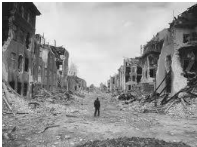
Fig. 6. Fotograma de El Pianista (Roman Polanski).

“...Para construir la Casa Ayuntamiento tal como se encuentra hoy se destruyó todo un barrio...” Honoré de Balzac alrededor de 1850 “Los pequeños burgueses”