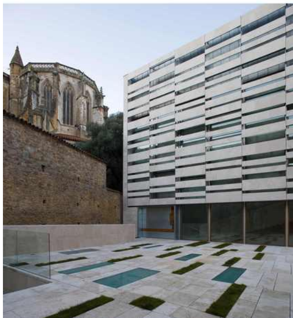
Fig. 10. Nuevo Museo Arqueológico.