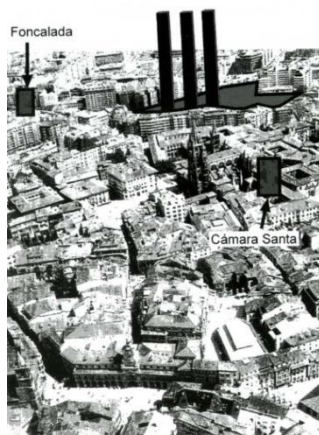
Fig. 4. Las tres torres de Calatrava.

TORRES CALATRAVA, EL TRIDENTE CLAVADO. También es un fraude, ya que la edificabilidad es de todos 11 , lo intentado en la parcela del Vasco en las inmediaciones del Oviedo Redondo. Escribí ya en el 2006 sobre la diferencia entre una maqueta y un proyecto realizado y el peligro en la inserción a tamaño real de aquella escultura tan bonita de Calatrava que veíamos y nos deslumbraba en el edificio histórico de la Universidad de Oviedo. El tiempo lamentablemente me ha dado la razón, pero sin entrar aquí en temas que ya se han escrito con profusión (terreno público que pasa a privado y que luego alquila a lo público...) lo lamentable es que la oportunidad de utilizar la nueva creación de un campo de fútbol como medio de desatascar el centro y de fomentar un crecimiento de la ciudad se hace realmente a pocos metros de distancia de donde estaba el anterior, desaprovechando una posibilidad de generar desarrollo urbano.