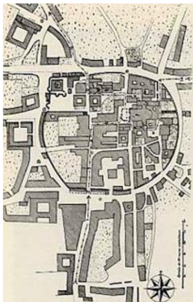
Fig. 1. El Oviedo Redondo.

La nueva arquitectura ha sido siempre la marca de su tiempo y el acicate para el crecimiento y desarrollo de ciudades y el no verlo así, el no comprometer la obra de uno mismo con la proa del pensamiento es renunciar al arte que tenemos 1 . Bien distinto es que en multitud de foros se repite la palabra “sostenibilidad” y entonces, uno no puede dejar de pensar en el derroche de esfuerzo, de horas, de intención, de ilusión, de vida que desechamos, tiramos, malgastamos cada vez que desaparece una trama, un palacio un elemento patrimonial que