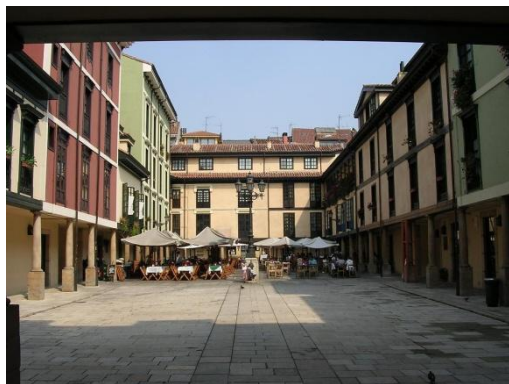
Fig. 17. El Fontán clonado.

En realidad cuando reeditamos un elemento, la población pierde el respeto porque desaparece uno de los valores fundamentales del punto firme de la ciudad: su antigüedad y su anclaje en el tiempo pasado. La verdadera barbaridad que nos dejó perplejos, que salió del periódico aquel día desayunando con la foto del Fontán derruido para volver a reeditarlo después (1996). Aparte de su utilización, como en casi todos los casos citados, como arma política, sin embargo esto no parecía, fuera de los ámbitos cultos en lo que a conservación del patrimonio se refiere, doler mucho a la ciudadanía. Es más, sirvió de justificación para