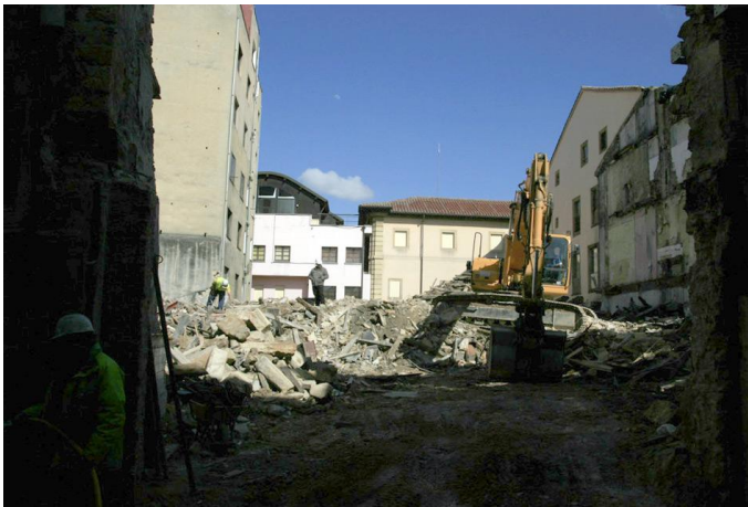
Oviedo: destrucción del Casco Histórico.

muy inadecuada para el mantenimiento de sus funciones y formas históricas. Frente a otras ciudades antiguas, que optaron por la permanencia de su personalidad y paisaje, Oviedo sufrió cambios estructurales, siempre bajo la presión del negocio que se aprovecha de tres recursos básicos: la vivienda, los bajos comerciales y el turismo. No ha habido una acción urbanística para el mantenimiento de los valores históricos ni para encauzar los negocios, de modo que resultaran funciones compatibles, sin merma de la calidad de vida de los residentes.