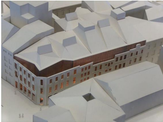
Fig. 8. Museo de Bellas Artes de Asturias. Fuente: estudio Patxi Mangado arquitecto.