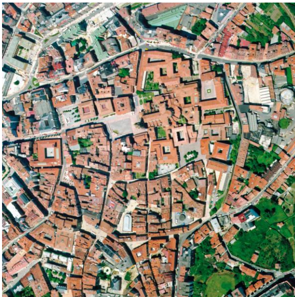
Casco Histórico en transformación.

En este ambiente ha prosperado la práctica del “botellón”, con lo que el deterioro del casco por ruido y suciedad se multiplica. Y por si todo ello fuera poco, este espacio es el seleccionado para la realización de toda clase de fiestas y festejos oficiales, con la instalación de carpas para actuaciones musicales y “chiringuitos” que expenden alcohol, en medio del estruendo. Así, los ruidos y el colapso hacen añicos las condiciones de vida de los residentes. La ardua tarea de limpieza para que, a primera hora de la mañana, la ciudad sea visitable para los turistas, comienza de madrugada con máquinas que baldean a presión sin control de ruidos, mientras los detergentes utilizados dañan gravemente el pavimento de las calles peatonalizadas.