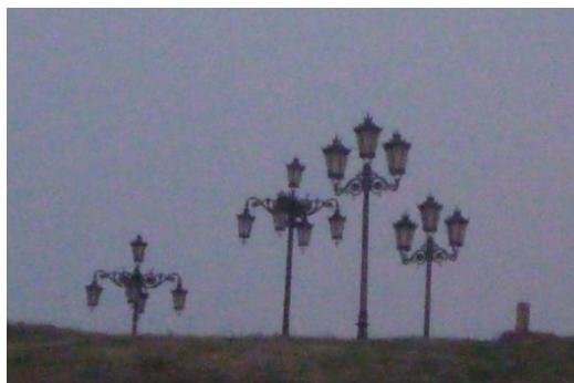
Fig. 14. Las farolas fantasmas.

Manjoya aparecían (Fig. 14) como si fueran fantasmas que durante bastante tiempo iluminaron incluso la noche del campo. Esto supone una falsedad histórica: eran nuevas repitiendo modelos centenarios y aparecían en cualquier situación y contexto.