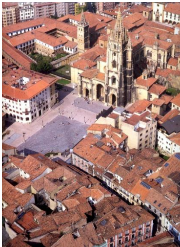
Fig. 9. Manzana afectada por Bellas Artes.

ahora como aquellas manzanas de mi memoria. " En realidad, y esto lo contemplo ahora, algunos de los dibujos del Plan de Pol planteaban una posibilidad de edificación en la Plaza de la Catedral y lo mejor hubiera sido, sacar orgullosa la nueva arquitectura a la plaza frente a la gran fábrica gótica y hacer un túnel subterráneo que fuera dando paso a cada palacio de la calle la Rua. La grandeza del Museu Picasso de Barcelona, de Garcés y Soria, reside en que tras la intervención cada palacio de la calle Montcada sigue estando allí, pero todos juntos son además otra cosa (cinco palacios para un museo). En Oviedo lamentablemente las cosas no fueron así.