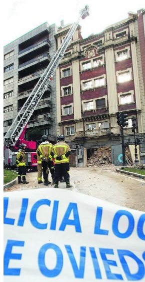
Fig. 3. Edificio Universidad catalogado y demolido.

3) es otro ejemplo (¿ignorancia o fraude?) 8 . Con este ejemplo pasamos al siguiente párrafo.