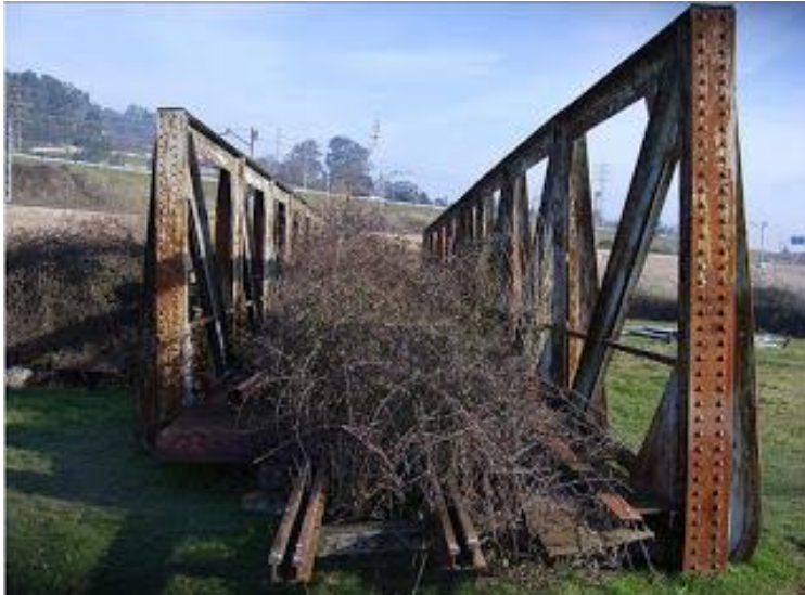
Fig. 2. Puentes de hierro roblonado eliminados por Cinturón Verde.

haga uno del siglo XXI es ignominia. Es importante también que se utilice el mismo rasero para la ciudadanía que para la administración.