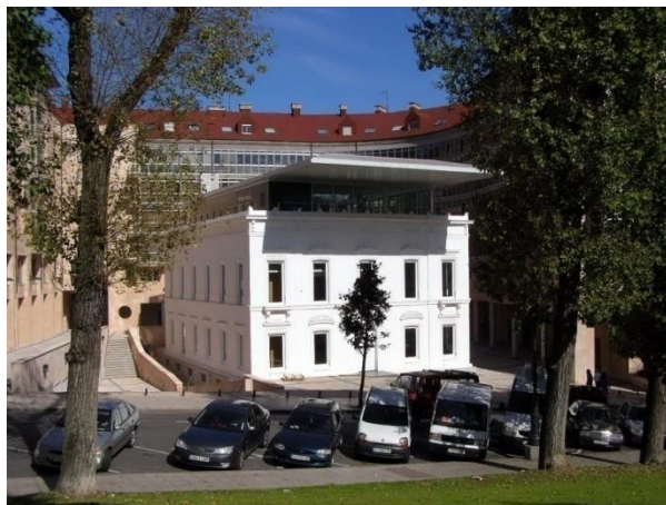
Fig. 11. Colegio Arquitectos sobre el Hispania.