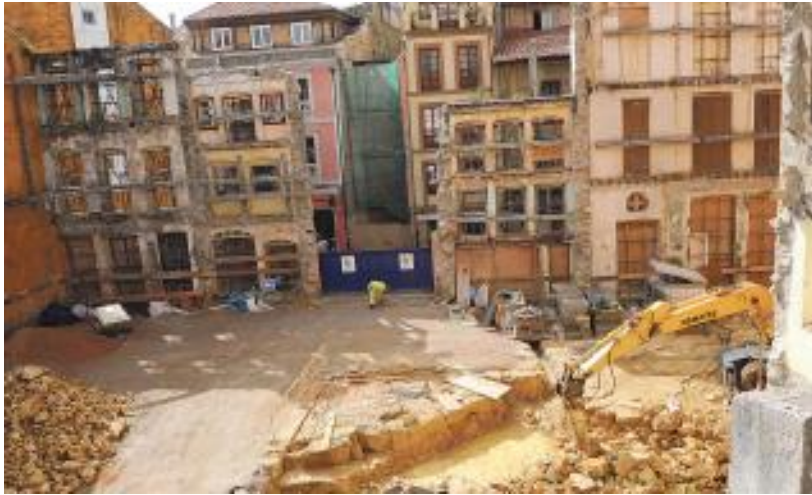
Fig. 7. Vaciado de manzana casco antiguo para nuevo museo.

Para construir El Museo de Bellas Artes de Asturias, tal como se encuentra hoy se destruyó toda una manzana de lo poco que nos queda del exiguo Oviedo redondo 13 . Añadir a esto que se dejaron, como muestra constante del genocidio los cadáveres, no creo que exquisitos, de las fachadas colgadas en la calle, como una prueba más de la prepotencia acontextual de la arquitectura que invitamos a venir a nuestras ciudades 14 .