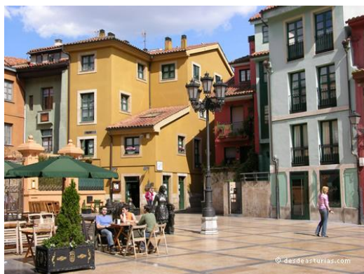
Fig. 15. Plaza Trascorrales gentrificada. Todo tan limpio que podría comer en su fregadero.

Veamos un ejemplo Trascorrales (Fig. 15): utilización de estas farolas, lechera y burrito, prácticamente todas las viviendas han sido reemplazadas (observad grosores de aleros mostrando su construcción en hormigón) y cromatizadas (rojo burdeos, ocre toscano, gris perla...),