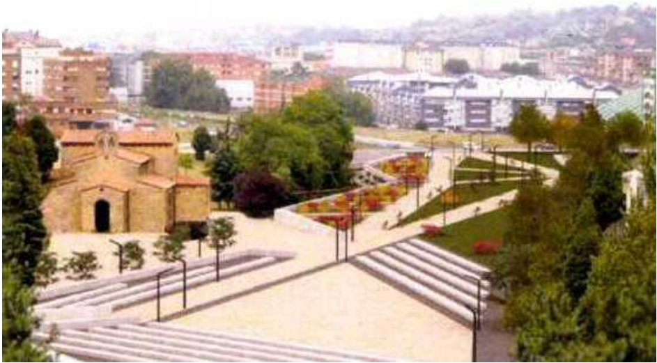
Fig. 5. Propuesta de ApiaXXI para entorno de San Julian de los Prados. Cedita por Fernando Nanclares.

No es necesario ser especialista para ver, desde el Centro Asturiano por ejemplo pero también desde el avión, la desproporción del centro de Buenavista. Esto es una agresión descomunal, ahora bien lo que es aún más grave y entra de lleno en el terreno de la codicia o fraude, es pretender hacer tres torres de 39 pisos inclinadas en las inmediaciones del Oviedo redondo, con vistas al convento de San Pelayo. Quien propone esto, poco después de haber hecho otra propuesta, en la semana de Navidad, pretende cogernos con el intelecto dormido y hacer (lo que no se hizo gracias al esfuerzo de muchos que nos sentimos sobrecogidos, impotentes, pero que no paramos) una utilización privada de un derecho público que es la edificabilidad 11 . Lo curioso es ver en la hemeroteca los compañeros que apoyaban desde el periódico esta barbaridad ovetense. Esto es también fraude porque el que apoya una intervención como esta desde la disciplina arquitectónica o urbanística sabe que está mintiendo y lo hace con intención oculta de