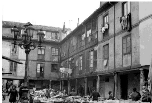
Fig. 16. El Fontán antes.