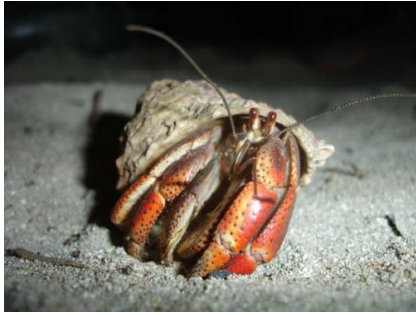
Fig. 12. Gentrificación. Expulsar del casco sus habitantes para nuevas funciones.