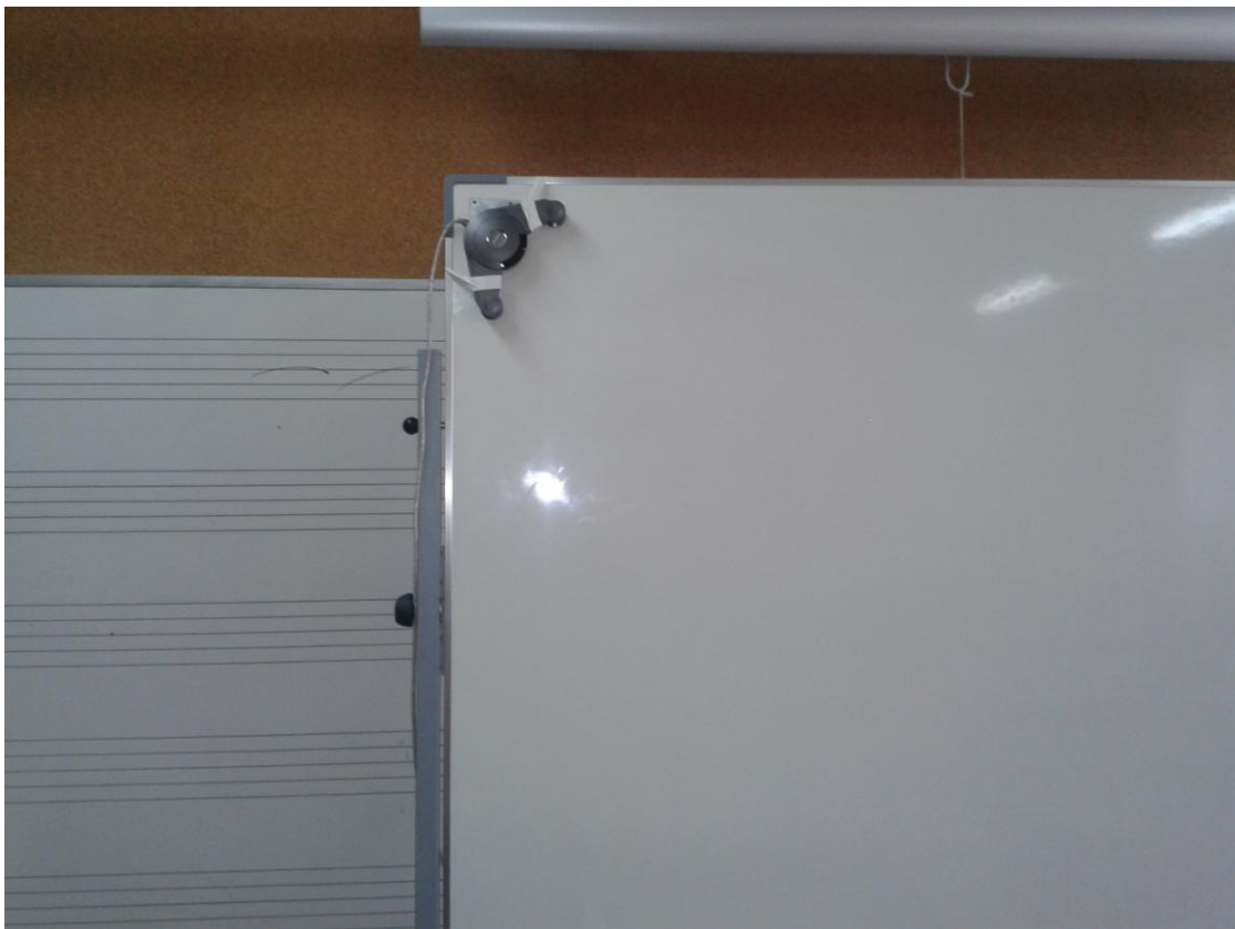
en IES Alas Clarín. 22/04/2014

Para mi resultaría muy útil en las aulas de inmersión y serviría al alumnado para fijarse en sus fallos. Este tipo de medios son prácticos, porque consigue motivar a los alumnos que no conocen el dispositivo. Es un buen procedimiento para que presten atención en la clase.