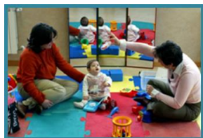
Atención Temprana Especializada

- Atención semanal: media de 55 casos semanales, de los que aproximadamente 42 se atienden de forma periódica en logopedia, estimulación, comunicación, apoyo psicológico y atención familiar, y el resto en seguimiento audioprotésico.