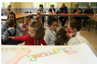
Taller de familias