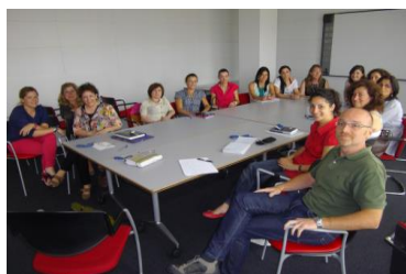
Reunión de equipo PADAI

-Coordinación periódica y reuniones presenciales bianuales en el marco del PADAI y mensuales con la red de Unidades de Atención Temprana