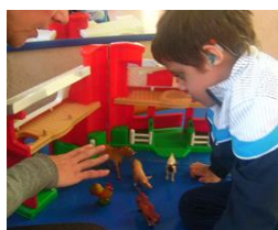
Trabajo en red con otras UAIT