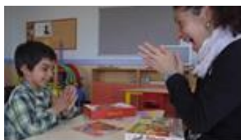
Rehabilitación de Implante Coclear