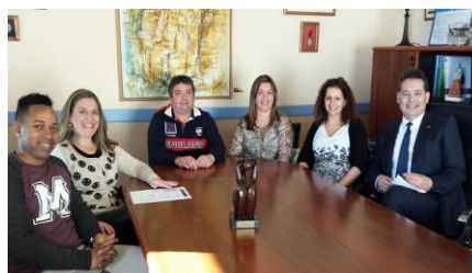
Participación familiar: Evaluación de Calidad