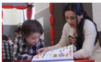
Intervención con niños/as escolarizados

- Seguimiento audioprotésico: entre 180-200 niños y niñas escolarizados/as anualmente